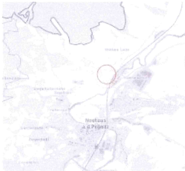
Lage des Gebietes – ohne Maßstab

Der Marktgemeinderat des Marktes Neuhaus a.d.Pegnitz hat in seiner öffentlichen Sitzung am 16.04.2024 den Bebauungsplan Nr. 11 „Freiflächen-Photovoltaikanlage Hammerschrott“ in der Fassung vom 16.04.2024 gebilligt und als Satzung beschlossen.